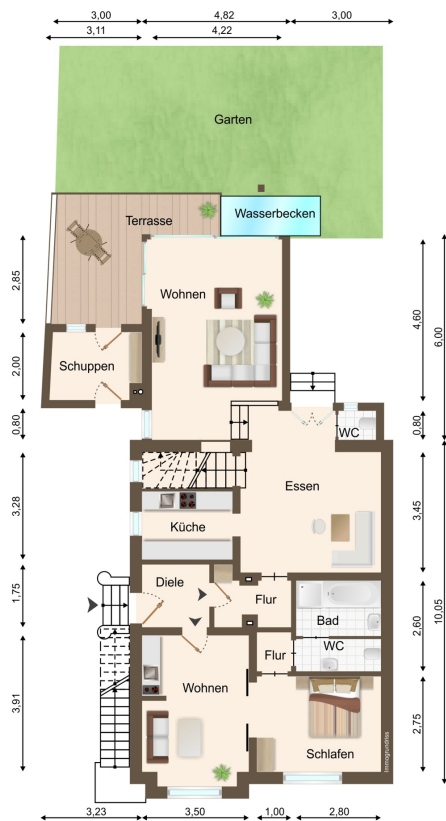
Grundriss 1. Obergeschoss