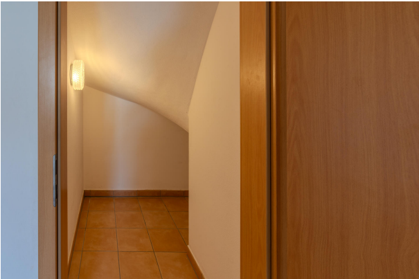
Praktischer Stauraum unter der Treppe!