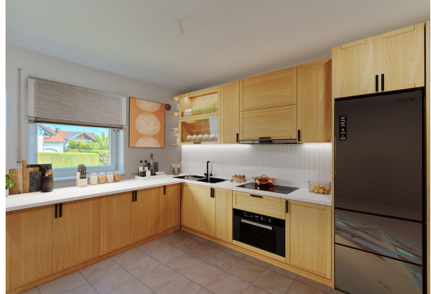
Einrichtungsbeispiel neue Küche!