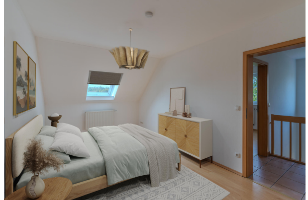
Gemütlich und ruhig!