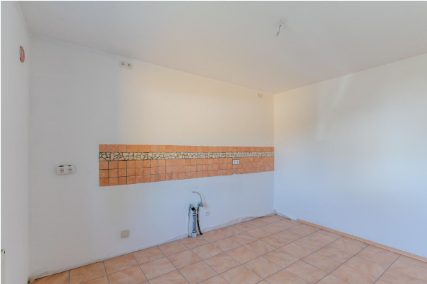
Zur individuellen Gestaltung!